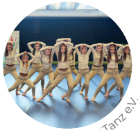
Der Tanz e.V.